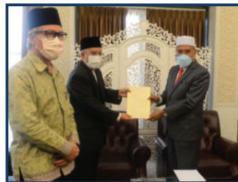
24 Februari 2022, YB Senator Datuk Haji Idris Ahmad, Mantan Menteri di Jabatan Perdana Menteri (Hal Ehwal Agama) telah menyampaikan watikah pelantikan jawatan Pengerusi IKIM kepada Allahyarham Prof. Emeritus Tan Sri Dr. Mohd Kamal Hassan.

Keilmuan serta ketokohan beliau diiktiraf sehingga ke peringkat antarabangsa. Allahyarham pernah diamanahkan sebagai Rektor Universiti Islam Antarabangsa Malaysia (UIAM) pada tahun 1999 sehingga 2006. Beliau turut berperanan sebagai Pengerusi, Lembaga Penasihat Penyelarasan Pelajaran dan Pendidikan Agama Islam (LEPAI), yang ditubuhkan dengan perkenan Majlis Raja-raja. Allahyarham dilantik sebagai Pengerusi IKIM pada 24 Februari 2022. Kepulangan Allahyarham ke alam abadi disifatkan sebagai kehilangan sebutir permata dalam dunia akademik. Semoga Allah menempatkan roh Allahyarham bersama orang-orang soleh. Amin. Al Fatihah.