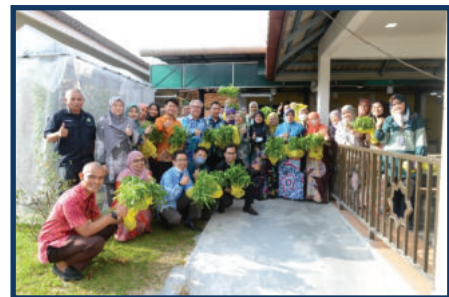
Keceriaan jelas terpancar pada wajah warga kerja IKIM pada program penyerahan sayur-sayuran hidroponik yang dikelolakan oleh Jawatankuasa Amalan Hijau IKIM.

Penanaman secara hidroponik ialah satu kaedah menanam tanpa menggunakan tanah. Selain daripada sayur jenis berdaun, sayur jenis buah dan pokok bunga boleh ditanam secara hidroponik. Kaedah ini memerlukan larutan zat makanan di dalam takungan yang berisi air. Kesuburan pokok dan hasil yang berkualiti bergantung kepada baja yang digunakan, benih yang elok dan juga cahaya matahari yang cukup.