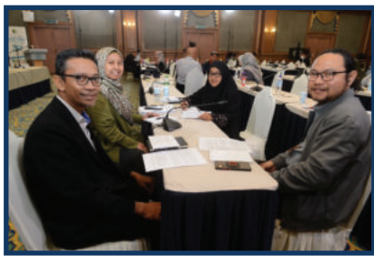
Antara peserta yang mengambil bahagian dalam Kursus Bimbingan dan Panduan Pengurusan Harta Keluarga Islam Tahun 2022 pada 22 dan 23 November 2022 di Dewan Besar, IKIM.