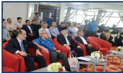
YB Tuan Haji Mohamad Sabu yang kini Menteri Pertanian dan Keterjaminan Makanan turut hadir pada program Syarahan Ulung oleh Profesor Emeritus Tan Sri Dr Mohd Kamal Hassan pada 25 Oktober 2022.