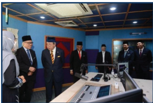
DYMM Tuanku Sharifuddin Ibn Sultan Salahuddin Ibn Shah, Sultan Selangor berkenan melawat studio Radio IKIM Pada 12 Oktober 2022.