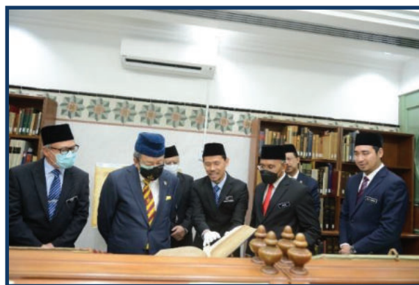
DYMM Sultan Selangor mengadakan lawatan ke Perpustakaan IKIM. Baginda diiringi oleh Profesor Emeritus Tan Sri Dr. Mohd Kamal Hassan, Pengerusi IKIM Pada 12 Oktober 2022.

Pada Lawatan Rasmi Diraja dan Titah Syarahan Diraja oleh DYMM Sultan Selangor bertajuk "Keharmonian Dalam Kepelbagaian" pada 12 Oktober 2022 di Institut Kefahaman Islam Malaysia (IKIM).