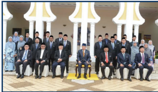
DYMM Sultan Selangor berkenan untuk sesi bergambar bersama barisan pengurusan kanan IKIM sempena lawatan baginda ke IKIM Pada 12 Oktober 2022.