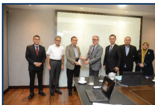
Sesi bergambar semasa kunjungan hormat kepada Pengerusi UMW Corporation Sdn. Bhd.